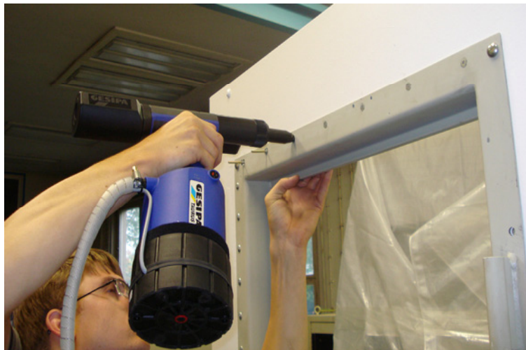
Alternative Montage von Türzargen durch Blindnieten nach der Endkonservierung ohne Nacharbeiten durch Schweißen