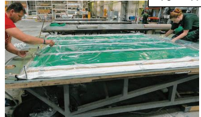
Derzeitige Fertigung von großflächigen, zweidimensionalen (ebenen) Bauteilen im Vakuuminfusionsverfahren bei der Fa. tfc - tools for composite